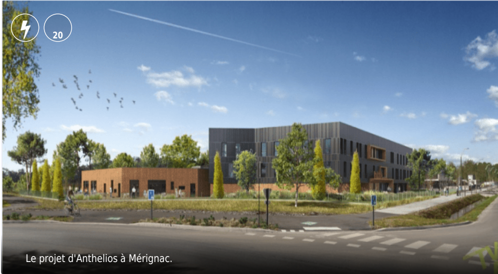
Le projet d'Anthélios à Mérignac.

Publié le 11 oct. 2022 à 10:50, mis à jour le 11 oct. 2022 à 17:03 - 20 conseils